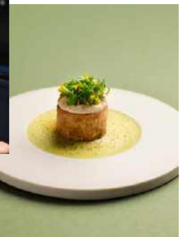
Salade de pommes de terre primeur de Noirmoutier et œufs de brochet fumés