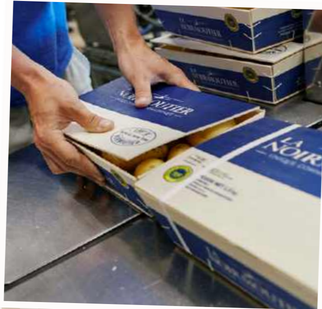
Conditionnées avec soins dans les traditionnelles bourriches.