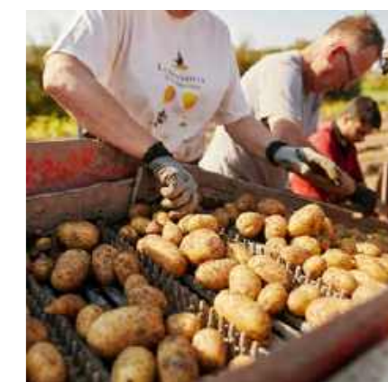
Récoltée seulement 90 jours après sa plantation.