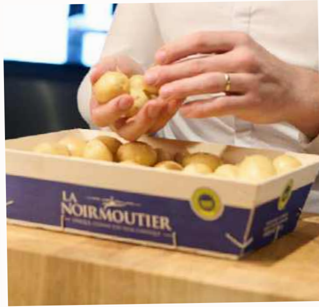
Une peau fine et naturellement peuleuse, qui se détache au frottement.

Sa récolte avant complète maturité lui confère pleinement son caractère de primeur. À ce stade, l'amidon n'est pas encore totalement développé : une partie des sucres naturellement présents n'a pas été transformée, ce qui explique sa légère sucrosité. À cela s'ajoute une subtile touche iodée, héritée des sols sablonneux enrichis au goémon et des embruns marins.