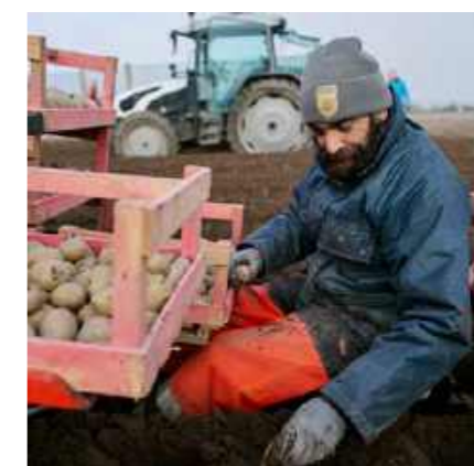
Un geste rare et précis, encore réalisé à la main à Noirmoutier.